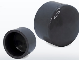
TABLA DE DIMENSIONES