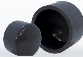
TABLA DE DIMENSIONES